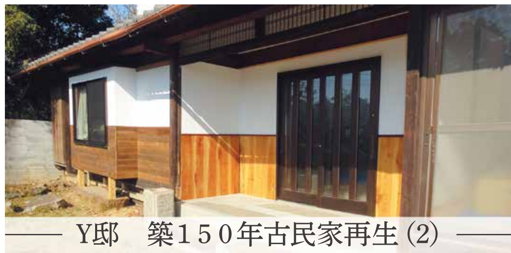
Y邸 築150年古民家再生(2)

小山建設で建てられた 住まいを訪問し、今後 より良い家づくりをする ためのヒントを見つけ たいと思います。