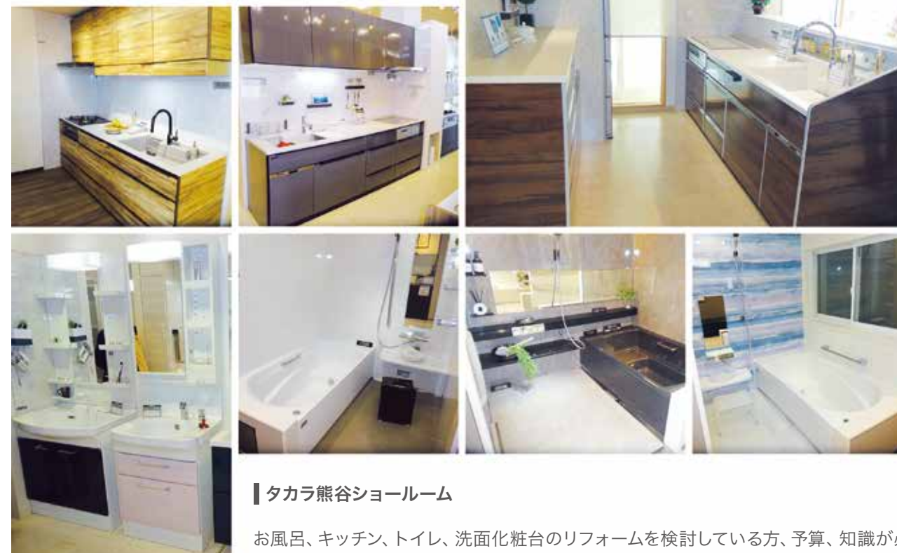
タカラ熊谷ショールーム

お風呂、キッチン、トイレ、洗面化粧台のリフォームを検討している方、予算、知識が必要な方はショールーム見学をお勧めします。