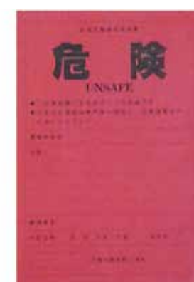
この建物への立ち入りは危険