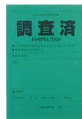
この建物は使用可能

判定結果は緑（調査済み）黄（要注意）赤（危険）の三段階で区分し建築物の出入口など見やすい場所に表示して建築物の利用者だけでなく付近を通行する歩行者などに対しても安全性の識別が出来るようにする。