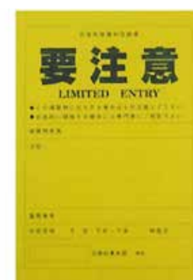
この建物への立ち入りは十分注意