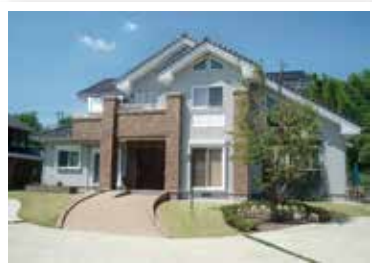
いつまでも過ごしやすい住まいに