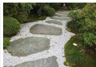
風格を損なわないバリアフリー

たったこれだけのことでお客様の顔から安心感が感じられたと、後程伺いました。大掛かりなリフォームを行わなくても、ちょっとした工夫でバリアフリー化出来るものです。