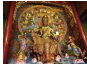
写真：左上から時計回りに、麻婆豆腐のディスプレイ、武侯祠の参道、凌雲寺の観音菩薩