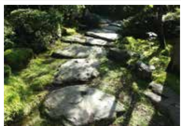
素敵な飛び石ですが転倒の心配も…

さいたま市岩槻区にある懐石料理店の「桜茶屋」。懐石料理店の庭といえば「飛び石」はつきもの。和風の風情を醸し出しています。