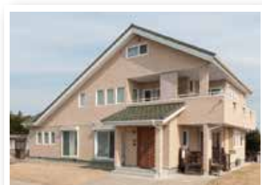
ソーラーサーキット住宅。築6年。

「まあ、古くなったというのと退職し家を造りたかった。昔の家だから冬が寒かった。本やネットで冬の暖かさ夏の涼しさを調べていた。」