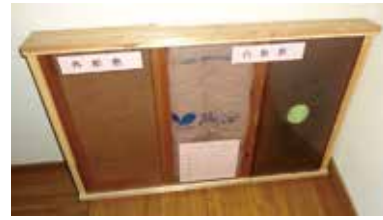
当社手作りの断熱模型です。 左からポリスチレンフォーム二重通気断熱材。 中央がグラスウール断熱材。 左が充填式発泡材です。

その点、当社で採用している発砲系の板材ポリスチレンフォームは熱伝導率、不燃性、耐久性、吸水性、防音性に優れています。夏の熱蒸れを防ぐために床下換気口を開けて壁の隙間を通して熱を外部に放出しています。断熱材はとても奥が深いのです。