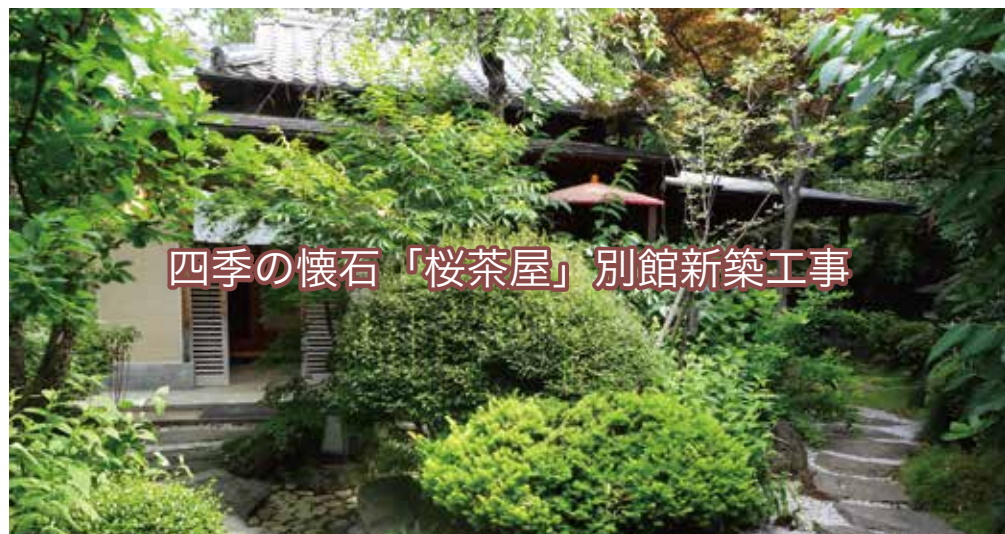
四季の懐石「桜茶屋」別館新築工事

自然に囲まれた、この空間が、さいたま市内で国道16号線沿いにあるとは思われない。お客様は料理、建物、庭と3回楽しむことが出来る。