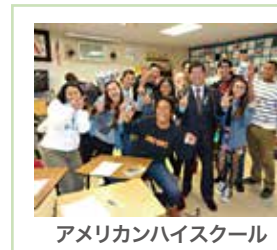
アメリカンハイスクール