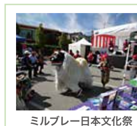
ミルブレイ日本文化祭

翌日広場で開催されていた「日本祭り」でも子供から大人までステージを中心にみんなの協力と知恵で成り立っているのがみ取れた。でも一番びっくりしたのはスピーチに立ったミルブレイ市長が美人すぎる事だった。この時の訪問で参加者一同アメリカに飲み込まれてしまった。